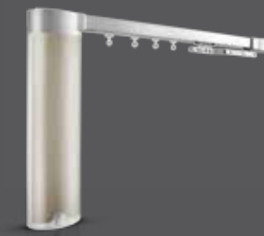
Glydea ULTRA 35e