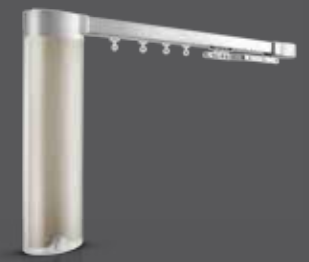
Glydea ULTRA 60e